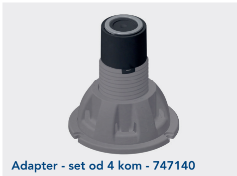
Adapter - set od 4 kom - 747140