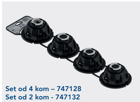
Set od 4 kom - 747128 Set od 2 kom - 747132