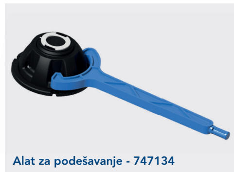
Alat za podešavanje - 747134